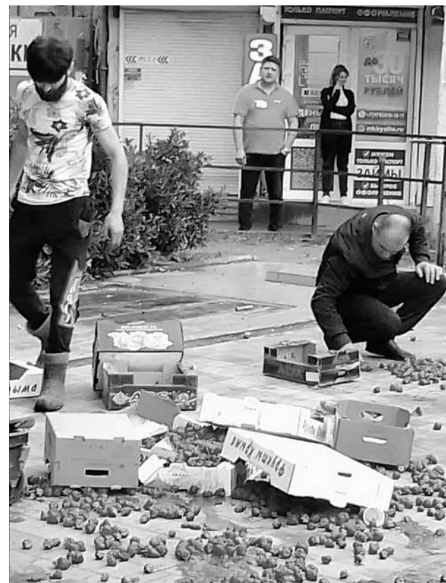
На остановке «Овощной рынок» -- стихийная торговля с боями без правил «Клубничная страда»