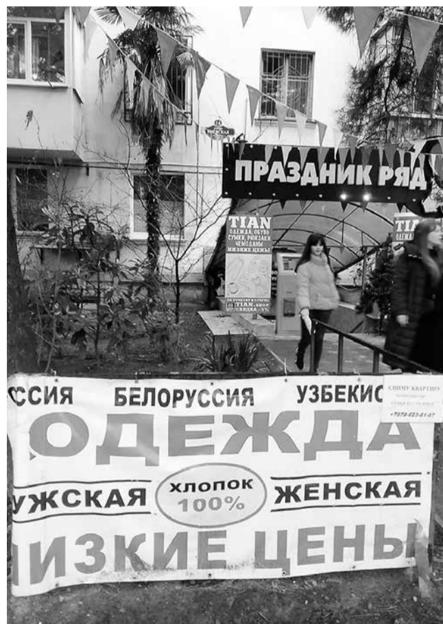
На улице Киевской реклама со смыслом «Пойди туда, не знаю куда, а здесь этого товара нет, но, может быть, что-то да выберете».